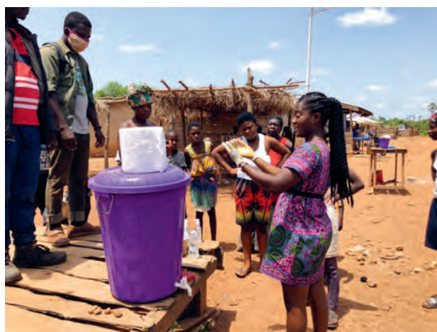
Ghana: Hygieneschulung in ländlichen Gebieten

Durch die große Solidarität unserer Salesianerhäuser in Österreich und mithilfe großzügiger Spenderinnen und Spender konnten wir unsere Arbeit auch in der Coronakrise gut fortsetzen und ausbauen.