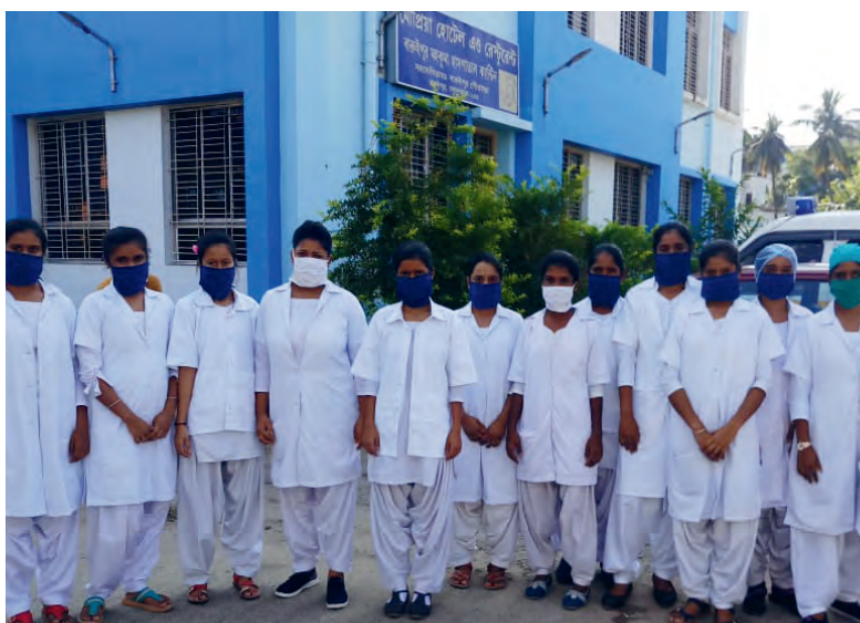
Health Trainees - Medizinisch Auszubildende eines Krankenhauses in Baruipur, Westbengalen.

https://www.teilen.at/ https://www.dka.at/