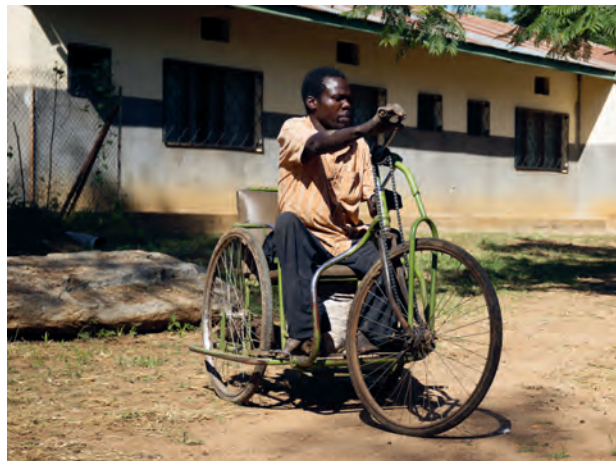
Fahrradaktion 2020 im Kongo

indem sie die kraftlosen Beine nachzogen. Insgesamt 65 Dreiräder, welche aus einer Spezialkonstruktion aus zwei handelsüblichen Fahrrädern zusammengebaut sind, sollten es werden. Diesen Herzenswunsch konnte die MIVA erfüllen!