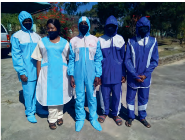
COVID-Schutzausrüstung für kirchliche Spitäler in Simbabwe