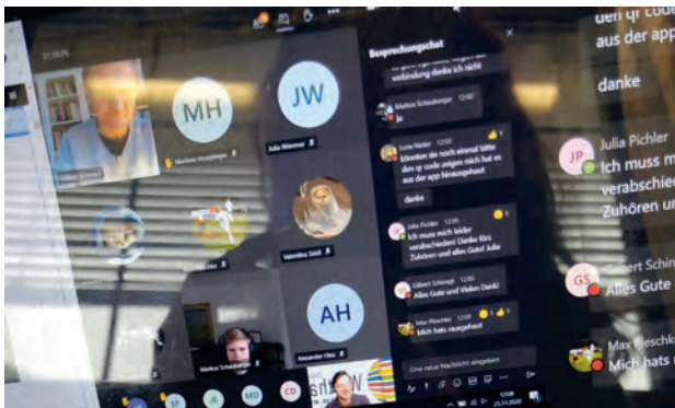
Medienworkshop "SuyL 20/21– Kauft, und alles wird gut!"

Wie sehr lässt du dich von Werbung, von InfluencerInnen beeinflussen? Was sind die 6R ("Re-Think", "Re-Fuse", "Re-Duce", "Re-Use", "Re-Pair" und "Re-Cycle") des nachhaltigen/kritischen Konsums? Mit diesen und mehr Fragen setzten sich etwa 30 SchülerInnen an dem intensiven Workshop an der HLW in Steyr auseinander.