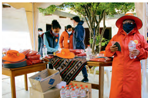
Die von Yachay Chhalaku verteilten Stoffmasken stammten aus der Nähwerkstatt eines Frauenhauses unserer Partnerorganisation Pastoral Social Caritas Sacaba.

verkaufen, eine Sondererlaubnis weiterhin geöffnet zu halten. Zum anderen lancierte Yachay Chhalaku im Rahmen der Projektaktivitäten zur Gewaltprävention die Informationskampagne „Quarantäne ohne Gewalt“. Die Kampagne, die über das Recht auf Schutz vor Gewalt informiert, wurde vor allem über soziale Netzwerke verbreitet. Pro Gemeinde wurden zudem eine Frauennotrufnummer und ein Interventionsteam eingerichtet. Auch schaffte es Yachay Chhalaku in der kurzen Pause zwischen den Ausgangssperren, einige landwirtschaftliche Aktivitäten durchzuführen.