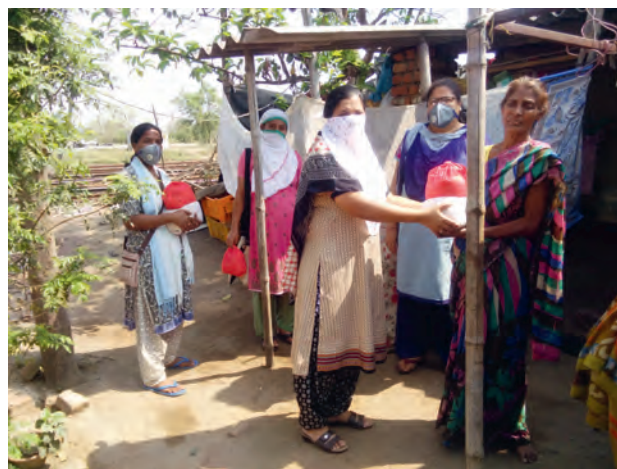
Lebensmittelverteilung in Indien

Die Bereitstellung von Lebensmitteln und Hygiene-/Medizinartikeln und die Sensibilisierung waren die Hauptmerkmale der Projekte. Die Projekte haben sich an jedem Ort auf einzigartige Weise entwickelt: Die SVD in Togo legte 4000 km zurück, um Nahrungsmittel und die Gesundheitskampagne der Regierung in die abgelegenen Dörfer, die typischen SVD-Pfarreien, zu bringen. Die Community Welfare Society (CWS) Rourkela startete die Hilfsarbeit mit der Zusage von € 6 000,00 und stellte viele Pakete mit frischen Lebensmitteln sowie 65000 selbstgekochte Mahlzeiten zur Verfügung. Die SVD, SSps, Sozialanimatoren, Freiwillige, Behörden, NGOs, Schulen und Einheimische schlossen sich an. Wir müssen an die 2 Fische und 5 Brote denken.