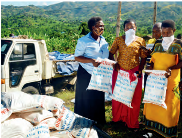
Hilfslieferungen für Uganda

Mit März des vergangenen Jahres standen die Menschen in Partnerländern und -organisationen von SEI SO FREI Oberösterreich einmal mehr vor immensen Herausforderungen. In Uganda trat der totale Lockdown in Kraft und verlangte der ohnehin sehr armen Bevölkerung in unserem Projektgebiet weit abseits der Städte, wo jegliche Möglichkeiten Geld zu verdienen komplett ausfallen, alles ab. Drei Wochen Starkregen und Überflutungen im Mai verschärfte die Situation noch einmal dramatisch. Das waren Voraussetzungen, die dem Hunger ganz unmittelbar Vorschub leisteten. Die anstehende Ernte wurde komplett vernichtet und aufgrund der hohen Nachfrage stiegen die Lebensmittelpreise um das Zweieinhalbfache an. Die eigene Versorgung war angesichts der harten Strafen, die drohten, wenn man die Ausgangssperren missachtete, fast undenkbar.