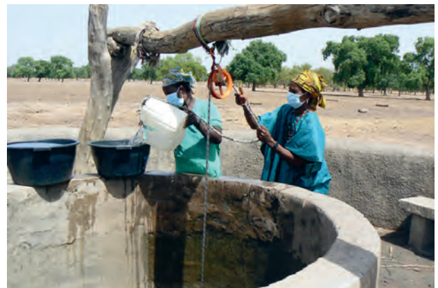
Wasserschöpfen im Senegal

die ländliche Bevölkerung verteilt, um die Menschen vor einer Infektion zu schützen. Gleichzeitig konnten MitarbeiterInnen der Partnerorganisation vor Ort die Menschen aufklären und sensibilisieren, wie sie sich vor dem Virus schützen können. Die Caritas unterstützte auch Nothilfemaßnahmen gegen Armut und Hunger. In Syrien zum Beispiel haben wir Bargeldzahlungen an Familien geleistet, Damit konnten sie ihren Bedarf an Grundnahrungsmitteln, Hygieneartikeln und Wohnkosten decken. Regelmäßig wurden auch Nahrungsmittelerationen verteilt. Die Pakete halfen jenen, die durch Corona jede andere Einkommensmöglichkeit verloren hatten. Eine besonders vulnerable Gruppe war außerdem die der geflüchteten oder intern vertriebenen Menschen: zum Beispiel im Nahen Osten, in Griechenland, am Balkan und in Krisenregionen in Afrika war die Unterstützung der Caritas überaus dringend und überlebensnotwendig.