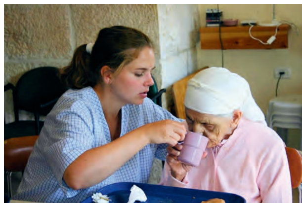
Beit Emmaus: Die Versorgung der zu Pflegenden hat Priorität.

Das Coronavirus beeinträchtigte das Leben in Palästina bereits seit März 2020 massiv, auch jenes von Beit Emmaus. Grenzsicherungen zu Israel und Ausgangssperren machten die Versorgung mit Lebensmitteln, Medikamenten und Produkten, die für die Versorgung der bettlägerigen Bewohner unabdingbar sind, fast unmöglich. Die hohen Infektionszahlen in Palästina und Israel bereiteten den Schwestern von Anfang an große Sorge, berechnete Sorge, wie sich herausstellen sollte. Gegen Ende des Jahres erkrankten alle 35 Frauen in Beit Emmaus, dazu einige Krankenschwestern und Salvatorianerinnen an Covid-19.