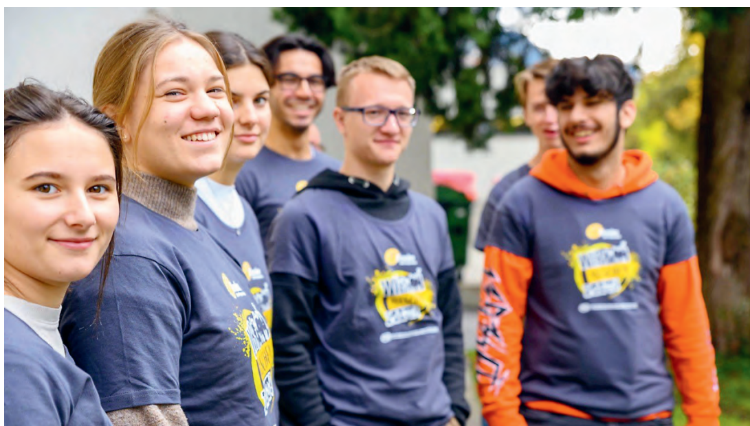
72 Stunden ohne Kompromiss

den wurden abgesagt bzw. nicht abgehalten. Betroffen davon war zum Beispiel die bekannte österreichweite gemeinnützige Veranstaltung "72 Stunden ohne Kompromiss", welche in diesem Jahr inklusive Covid-19 Konzept nachgeholt wird. Abseits von Veranstaltungen gibt es natürlich vieles, das normalerweise in der KJ auf Pfarrebene stattfindet und nicht wie gewohnt weitergeführt werden konnte. Dennoch, wo es ging, wurde auf online geschwitched. Auch unsere österreichweite Bundeskonferenz mit über 70 Personen fand als dreitägiges Event inklusive Wahl via Zoom statt.