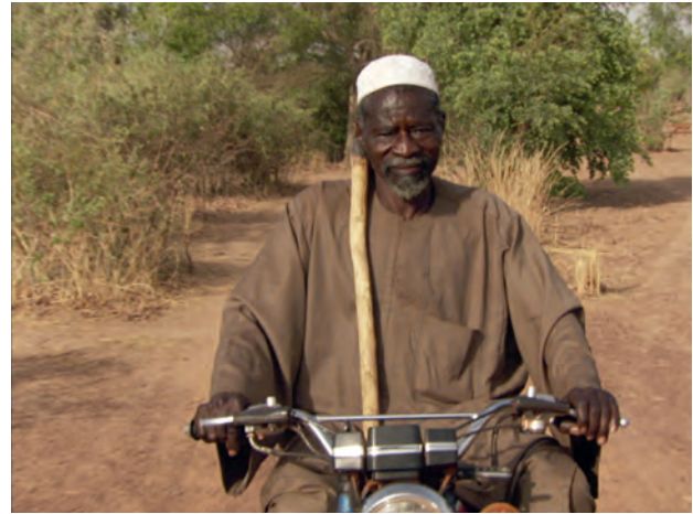
Der Landwirt Yacouba Sawadogo in Bukina Faso besann sich auf das Wissen seiner Vorfahren und schaffte es der Verwüstung Einhalt zu gebieten.