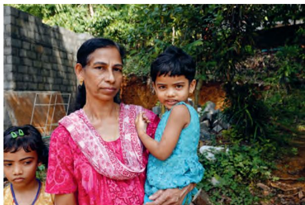
Mutter mit Kindern in Indien. Unterstützung von Familien durch Förderung der landwirtschaftlichen Entwicklung, um deren Lebensgrundlage zu verbessern.

Für die Unterstützung der Pfarren für die Sammlung 2021 stellt das Hilfswerk Fastenaktion Informationsmaterial bzw. Beschreibungen von Projekten und einigen Tipps zur Durchführung wie „Fastensuppe im Glas“, Aktion „Solidaritätseuro“, Suppenwürfel gegen Spende, Fastenwürfel für Familien, Schulen, Kinder- und Jugendgruppen zur Verfügung. Dies geschieht mit den genannten Kooperationspartnern.