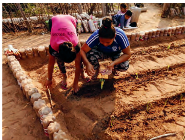
Anlegen eines Schulgartens in Tentaguazu

Jene Kinder in den verstreut liegenden Bauernschaften, die normalerweise bei Gastmüttern untergebracht sind, wurden alle zwei Wochen von Lehrer*innen besucht. Neue Unterrichtsmaterialien wurden übergeben und die bearbeiteten Materialien vom vorausgegangenen Besuch eingesammelt. Dabei konnten Fragen der Kinder geklärt und Erläuterungen gegeben werden.