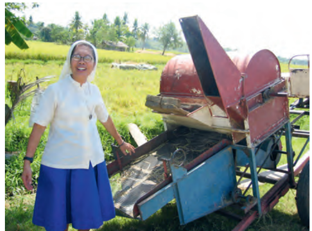
Reismühle - Ernährung sichern: mit der kleinen Reismühle dreschen die Bäuer*innen ihren Reis selber. Unterstützt durch Spenden aus Österreich gewinnen sie damit ein Stück Unabhängigkeit und Selbstbestimmung.