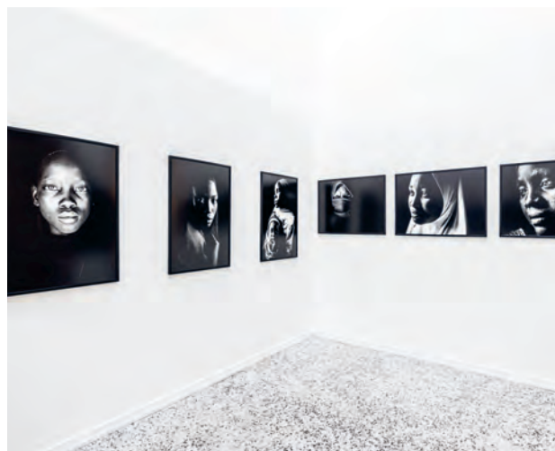
Ausstellung: „Die geraubten Mädchen“ von Andy Spyra

Formate wie Lesungen, Ausstellungen, Vorträge, Dialogrunden, Workshops, Aktionstage usw. wurden durchgeführt, notgedrungen auch Online. Der „persönliche“ bzw. der „direkte Kontakt“ war und ist dem Team des AAI besonders wichtig, aber – wie wir alle wissen – seit Anfang März 2020 eingeschränkt. Das Programm musste daher – gemäß den geltenden Vorschriften – adaptiert werden, zum Teil mehrmals: so z.B. die sich mit den Opfern von Boko Haram auseinandersetzen Ausstellung „Die geraubten Mädchen“ des Fotografen Andy Spyra, deren Eröffnung abgesagt werden musste, schlussendlich aber bis Juli gezeigt werden konnte.