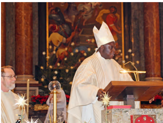
Besuch von Bischof Toussaint Iluku in Salzburg

Es war eine große Freude, dass der neue Bischof von Bokungu-Ikela, Toussaint Iluku Bolumbu, auf Einladung von Erzbischof Franz Lackner am Partnerschaftstag 2020 zu Gast in Salzburg war; als Bischof war es sein erster Besuch in Salzburg. Der damals 54-jährige Regionalsuperior der Herz-Jesu-Missionare wurde am 13. Mai 2019 zum Bischof von Bokungu-Ikela ernannt und am 21. Juli 2019 in Bokungu geweiht. An der Weihe nahm auch eine Delegation aus Salzburg unter der Leitung von Weihbischof Hansjörg Hofer teil.