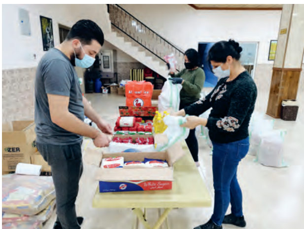
Corona-Soforthilfe: Ehrenamtliche bereiten Lebensmittelpakete für bedürftige Familien vor

Wir freuen uns über einen neuen Spendenrekord im Jahr 2020 mit erstmals mehr als 1,13 Mio. Euro an Spenden in einem Jahr. So war es uns möglich, 65 Projekte mit rund 948.000 Euro in unseren Schwerpunktländern im Nahen Osten erfolgreich zu realisieren und vielen Menschen zu helfen.