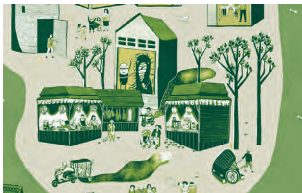
Auszug aus dem Wimmelbild zum Thema Weltgesundheit