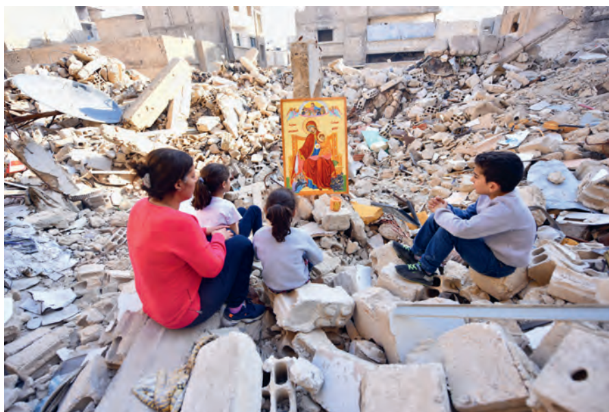
Kinder in Syrien