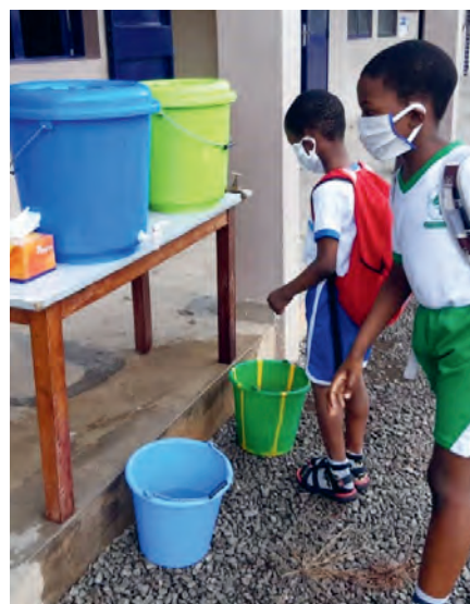
Benin: Handhygiene der Kinder entsprechend der Corona-Auflagen

Dieser Prozess hatte zum Ziel, aus der kirchlichen EZA-Arbeit in Vorarlberg ein gemeinsames Zukunftsbild zu schaffen, das von Effizienz und Effektivität geprägt ist, und wurde partizipativ durch Einwirken der bisherigen Mitgliedsorganisationen gestaltet.