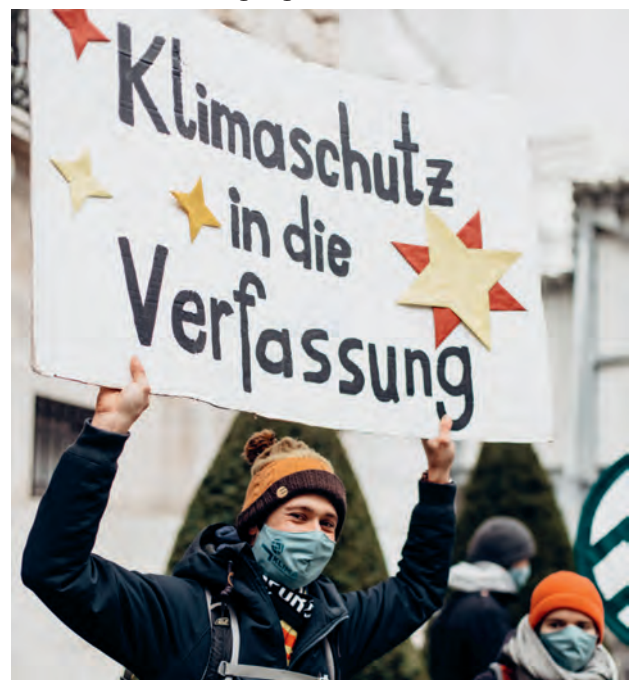
16.12.2020: Klimavolksbegehren mit Appell an den Umweltausschuss: Hört auf die Wissenschaft und handelt jetzt!

Zudem konnte sich die KOO im vergangenen Jahr noch einmal stärker als zivilgesellschaftliche Expertin für Klimafinanzierung innerhalb von nationalen und europäischen Netzwerken durch Referate, Inputs, Feedbacks und Veranstaltungsteilnahmen positionieren und nicht zuletzt die erfolgreiche Seminarreihe Klimagerechtigkeit überarbeitet in den zweiten Durchgang ab Mitte 2021 schicken.