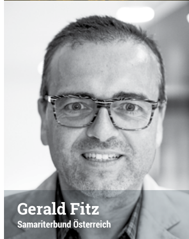
Gerald Fitz Samariterbund Österreich